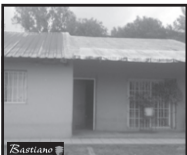
V.PINO, km 40, a 5 cds Ruta 3, Santiago del Estero 5960, lote 13.50x37.7 mts, casa 100 m², coc, liv com, 2 dor, bño, prque m/amplio, pocos detalles de termin, $ 600.000