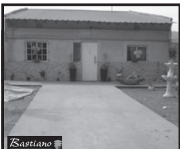
V.PINO, km 41.700, a 5 cds Ruta 3, Escribano 5324, lote 9x60, en condominio, casa super amplia, 136 m², 5 dor, 2 baños, amplia coc, liv com, ptio al fndo, prque, $ 750.000