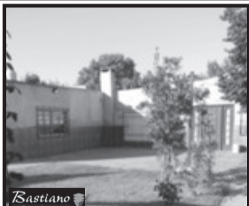
V.PINO, casa y locales, km 41.800, Ferrari 5657, a 4 cds Colectora y 1/2 asfalto, lote 18x45 casa 5 amb, ggex2, qcho y lav, 3 locales a termin, al fnte c/200 m² losa, $ 950.000