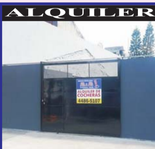
S/Rep de Portugal 2100, cocheras en alquiler, consulte