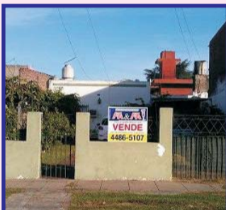
S/Lima a mts Portugal, jardín al frente, livg com, coc com, 2 dor, baño, patio, lav, e/auto