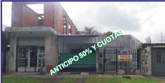
Sobre calle Albarracín, casa con local, 3 dormitorios, cocina comedor, comedor diario, living, 2 baños, local, lavadero, fondo libre, parrilla, entrada de auto, consulte.-