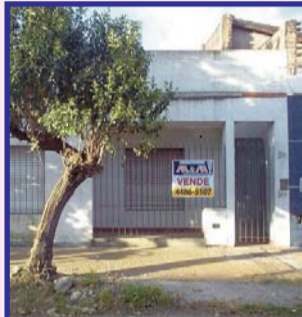
Casanova, sb/l.Malvinas, casa a estrenar, livg/com, cocina, 2 dor, bño, ptio y terraza