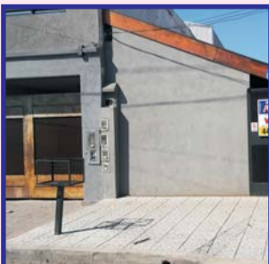
S/Rucci, PH al frente, 3 dor, coc comed c/desayunador, living comedor, baño, entre auto, patio c/lav y parrilla