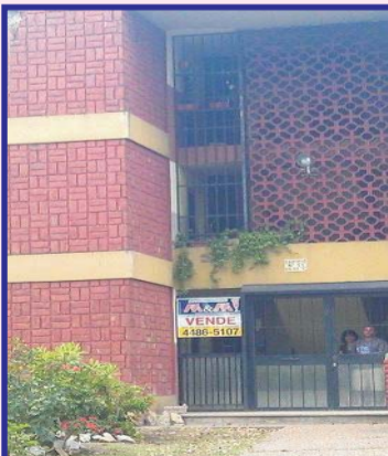
Barrio Luz y Fuerza, sobre calles Centenario y Balbastro, departamento en Planta Baja de 3 ambientes, con 2 dormitorios, baño, cocina comedor y lavadero, apto como para crédito!!!, consulte por valores.-