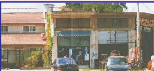
Sobre Juan Manuel de Rosas, casa con 3 locales de 3x10 metros instalados con altillo, casa: 3 ambientes, 2 dormitorios, cocina comedor, baño y lavadero semi cubierto