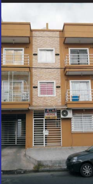
Edificios Isidro Casanova, Caracas al 6200, Roma al 2300 y 2900, Asunción al 6000, y República de Portugal 2200, anticipo y cuotas!!