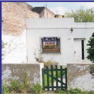
S/Avda Venezuela al 5700, lote 10x33 m, con casa precaria