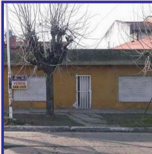
S/Seguí, 3 dor, living com, cocina, 2 baños, lavadero, garage, parrilla, entrada de auto