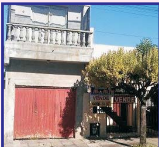
S/Habana, 2 plantas, PB: fte jardín, 2 dor, liv com, coc com, patio c/lav y parrilla, gge pasante, PA 2 dor, baño, balcón