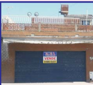
S/J. Alagón, PA: casa 3 amb, ptio c/lav, + depto 2 amb, PB: local 6x10 equipado p/panadería c/2 baños y 2 vestuarios.-