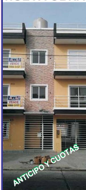
Isidro Casanova / San Justo sobre Sarrachaga y Madariaga, excelentes departamentos, todos totalmente instalados consultenos