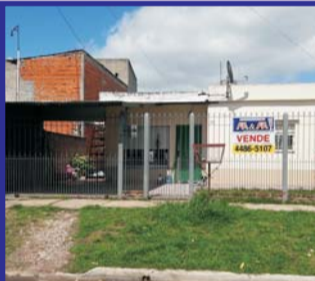
S/Bedoya, lote 10x39 mts, casa: 2 dor, coc/com, livg/com, baño, e/auto, ptio, depto fdo dor, coc/comd, baño, g/útiles