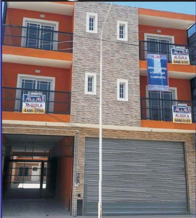
Edificio en alquiler, departamentos a estrenar 2 ambientes frente Plaza de Atalaya, desde $ 4.000 por mes.-