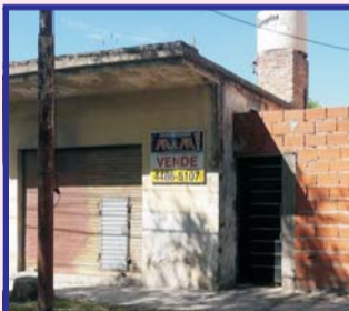
Sobre calle Islas Malvinas, casa a reciclar de 3 ambientes + local al frente, consulte