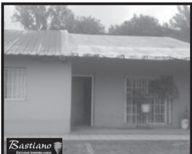
V.PINO, km 40, a 5 cds Ruta 3, Santiago del Estero 5960, lote 13.50x37.7 mts, casa 100 m², coc, liv com, 2 dor, bño, prque m/amplio, pocos detalles de terminación, $ 600.000.-