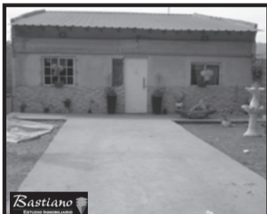
V.PINO, km 41.700, a 5 cds Ruta 3, Escribano 5324, lote 9x60, en condominio, casa super amplia, 136 m², 5 dor, 2 baños, amplia coc, lving com, ptio al fndo, parque, $ 750.000