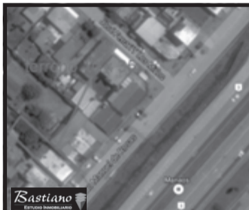
V.PINO, Colectora Ruta 3, km 42, lote 10x35 mts c/local, 130 m² cub en losa, amplio, al frente, garage y casa t/americana a remodelar, fondo libre, valor de u$s 120.000