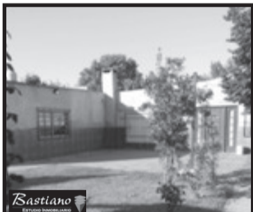
V.PINO, casa y locales, km 41.800, Ferrari 5657, a 4 cds Colectora y 1/2 asfalto, lote 18x45 casa 5 amb, ggex2, qcho y lav, 3 locales a termin, al fnte c/200 m² losa, $ 950.000