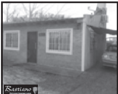
V.PINO, Chuquisaca 5500 km 46, lote 10x40 mts c/casa 2 ambientes, 35 m² cub, cocina comedor, dormitorio, baño con ducha y garage, valor $ 380.000, excelente!!!!