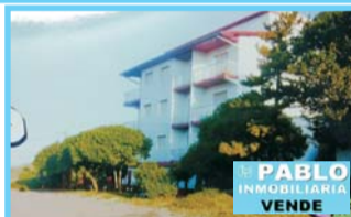
Villa Gesell, Costa Atlántica, depto 2 ambientes, dormir, com, coc, baño, frente al mar