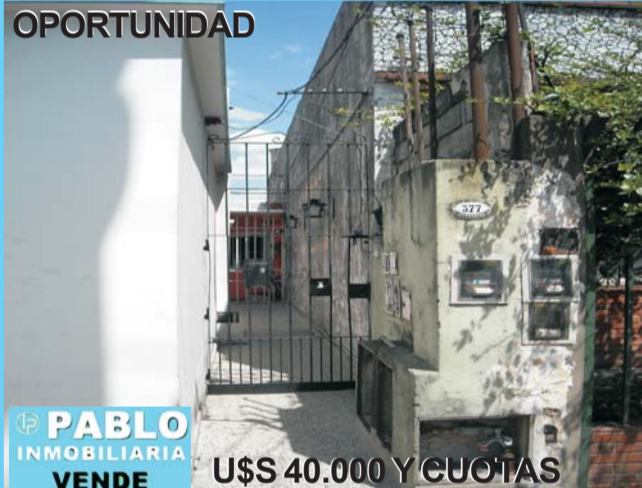
OPORTUNIDAD U$S 40.000 Y CUOTAS Departamento Morón centro, 2 dormitorios, comedor, cocina, baño, patio, lavadero, J.J.Valle ent/Buen Viaje y Mitre