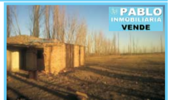
Provincia de Mendoza, consulte hectáreas, campo en la localidad de General Alvear.