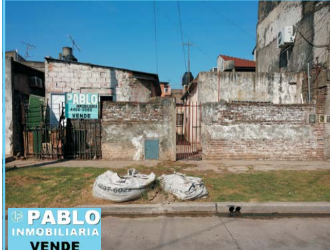
OPORTUNIDAD Emilio Sola e/Garibaldi y Guido y Spano, lote 10x20 mts, 3 c/deptos, ideal inversor, escucho propuesta, u$S 63.000