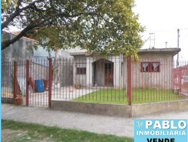
Pedro Ferre esquina Sudamérica, vivienda frente de rejas, 2 dormitorios, cocina comedor, baño, jardín al frente.