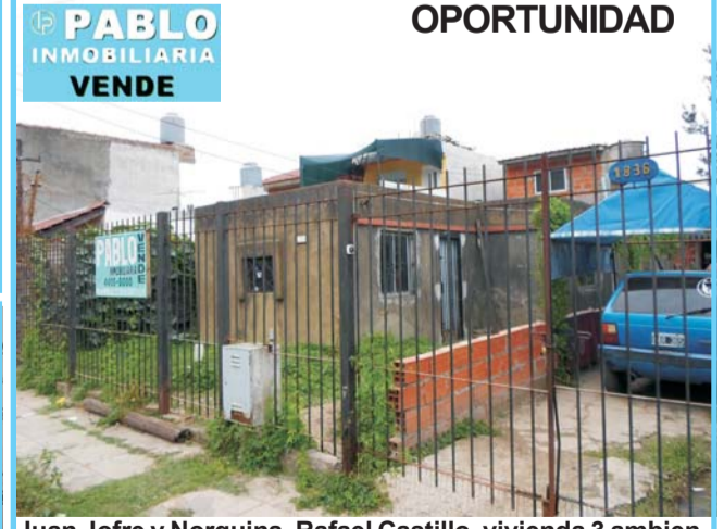
OPORTUNIDAD Juan Jofre y Norquins, Rafael Castillo, vivienda 3 ambientes 2 dormitorios, coc comedor, baño, patio, frente depto entrada auto, frente rejas, a 100 mtrs de Carlos Casares

VISITE NUESTROS SITIOS WEB: WWW.OFERTPROP.COM Y WWW.VENDOMIPROPIEDAD.COM