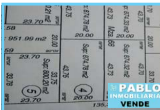
Merlo Gómez, 2 lotes baldíos de 20x40 metros c/u, salida a 2 calles, $ 380.000 y $ 340.000