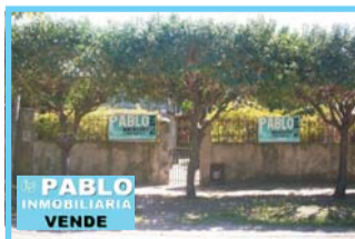
Vivienda zona centro, dormt, com, coc, baño, patio, Jde Kay y Hubac, R.Castillo, u$S 60.000