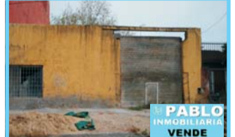
Castillo, galpón sobre Jorge de Kay entre Saladillo y Hubac, asfalto, 175 m² edificado