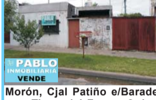
Morón, Cjal Patiño e/Baradero y Tierra del Fuego, 2 dor, com coc, bño y ptio, gas nat, a 200 mts de Avda Don Bosco