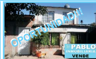
M.Gómez, Rojas y Doblás, indivisa 50%, 3 amb, l/com, ptio, prrilla, e/auto, $ 350.000 y ctas