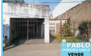
Castillo ctr, C.Casares e/Dra go y Granville, 3 dor, com coc, bño, ptio, gge, excelen ubicac