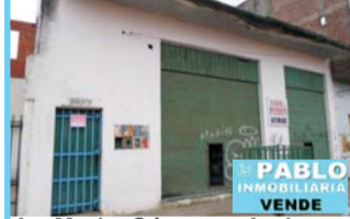
Av Merlo Gómez y Andonae gui, vivienda 3 amb parte fdo, frente 2 locales comerciales