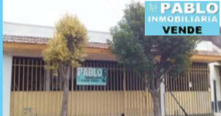
R.Lista y Montt, vivienda parte indivisa, 2 dorm, living comedor coc, baño, patio, lavad en/autos, servicios, $ 800.000