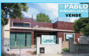
R.Castillo, S.Sosa y Granville, 2 dormitorio, living comedor cocina, bño, garage, $ 900.000