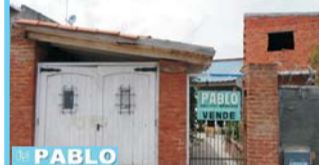
Indivisa, s/Bazurco fte hospita 2 dor, coc com, liv/com, bño, ptio, e/aut, $ 300.000 y cuotas