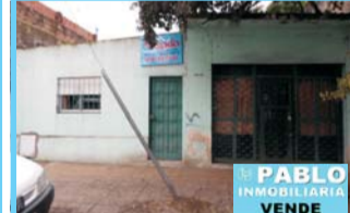
Castillo, vivienda 3 amb + local, excelente ubicación, Chavarría y Cordero, zona cntro