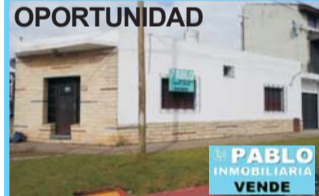
OPORTUNIDAD Burgos esq Charcas, Morón, PH, 2 dor, liv com, coc, baño, gge cub, lav, excelente ubic.