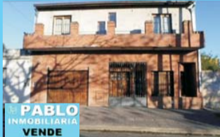
Morón S, 3 amb, liv com, ptio, lav, fondo grge, Avellaneda y Av Burgos, colectivos en prta