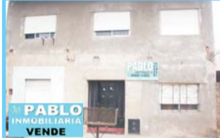
Beazley y Sosa, R.Castillo, 2 pntas, 4 amb, c/coc, ptio, e/aut, fdo hab, L15x17, $ 950.000