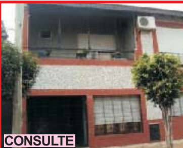
CONSULTE San Justo, Roque Pérez 3324, P.Baja: casa 2 dor, comed, cocina, baño, lavadero, cochera, patio, 1° piso: depto 2 dorm, com, cocina, baño, patio, lavader, frente balcón