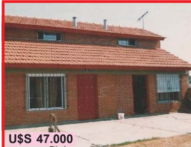
U$S 47.000 Mar del Tuyú, Partido de La Costa, Calle 55 N° 426 e/4 y 5, amplio dúplex 3 amb, patio, entrada auto, a 4 cds de la playa, m/buena ubicacion