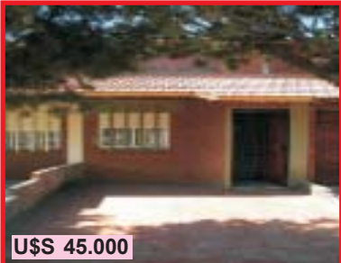
U$S 45.000 Mar del Tuyú, Partido de La Costa Calle 54 N° 95, dúplex a 1/2 cd de la playa, coc com, baño, peq patio, PA 1 dor y espacio 2° dor, exc ubicac