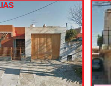
U$S 130.000 Isidro Casanova Moldes 4589 chalet 3 dormitorios en 1° piso, 2 baños, living, coc com, gge pasante, c/quincho y amplio ptio