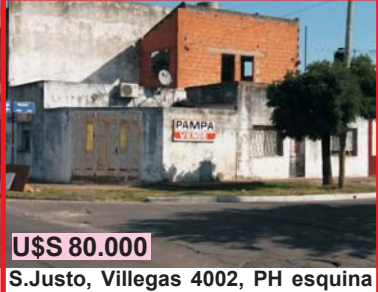
U$S 80.000 S. Justo, Villegas 4002, PH esquina e/Gral Madariaga y Villegas, 2 dormitorios, coc, com, baño, e/auto en ochava, construcción a termin en Planta Alta, buen vecindario!!!.-