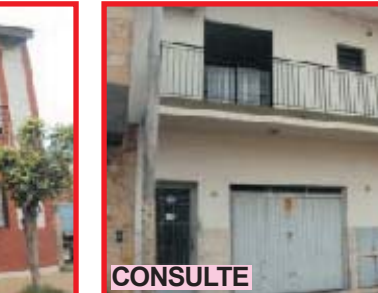
CONSULTE San Justo, Brasil 3354, multi familiar, 4 deptos, en block, Planta Alta depto 3 ambientes, otro 2 ambientes, Planta Baja garage + 2 deptos de 2 ambientes, lote de 10x30 mts