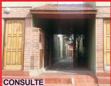
CONSULTE San Justo, Rincón 2765, dúplex interno con 2 dormitorios, comedor, cocina, 2 baños, lavadero, en excelente estado general!!!, consulte.-