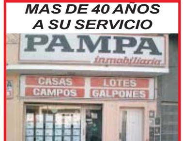
MAS DE 40 AÑOS A SU SERVICIO PAMPA Inmobiliaria CASAS LOTES CAMPOS GALPONES ATENCION DISPONEMOS DE ALQUILERES CON RECIBOS DE SUELDO, CONSULETENOS

BRIG JUAN MANUEL de ROSAS 5151 SAN JUSTO 4441-3149 / 4484-4595