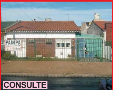
CONSULTE S. Justo, Constructora, Lezica 3687 amplio chalet 4 amb, lote 10x20, gge pasante, cuarto herramientas, lav, parrilla, a mtrs J.M. Rosas