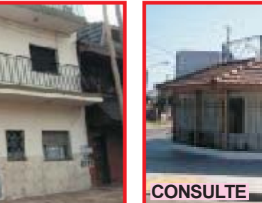
CONSULTE San Justo, calle Montañeses 4191 casa con 2 dormitorios, comedor, cocina, baño, lavadero, garage, terraza, muy buen estado de mantenimiento, con todos los servicios!!.-