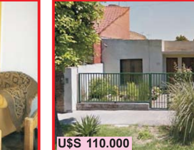
U$S 110.000 San Justo, Cisneros 4247, casa 3 ambientes con patio + departamento 2 ambientes, entrada de auto, buena ubicación, transport, hospital de niños a tan sólo 2 cuadras