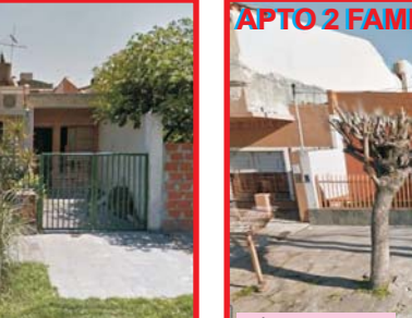
U$S 115.000 San Justo, Montañeses 4245 casa de 3 ambientes + departamento 2 ambientes a terminar, amplio fondo, garage, buen estado!!.-