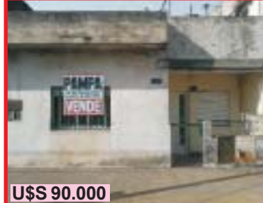
U$S 90.000 S. Justo, Centenera 4362, lote 10x30, P.B: fte dpto 3 amb, com, patio, P.B: fdo depto 3 amb, patio, P. Alta: frente depto 2 amb, multifamiliar.-