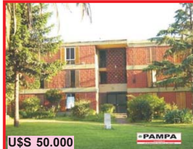
U$S 50.000 San Justo, Balbastro al 4500, oportunidad, departamento Barrio Luz y Fuerza, a 1 cd de 9 líneas de colectivos, son varios los disponibles!!