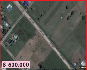
$ 500.000 Virrey del Pino, calle Aguirre 7025, lote de 53x28 metros, 1500 m 2 , a sólo 4 cuadras de la Ruta Nacional N° 3, imperdible oportunidad!!