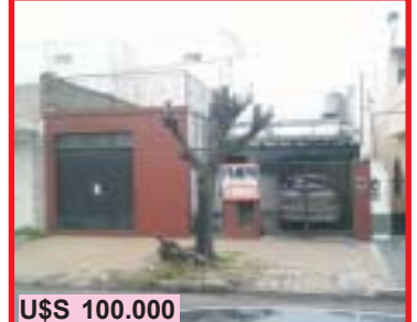
U$S 100.000 S. Justo, Zapiola 2826, a refaccionar 3 ambientes, comedor, patio, local y e/auto, lote 8.66x19, m/buena ubicación a 2 cds de la UNLM.-