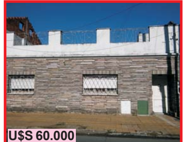
U$S 60.000 S. Justo, Guatemala 3211, B° S. Nicolás, PH interno 2 dormitorios, comedor, cocina, baño, lavadero, patio, terraza, a 2 cds J.M. Rosas.-