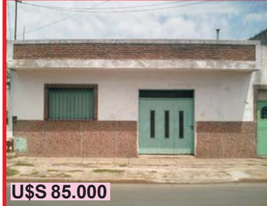
U$S 85.000 San Justo, Thames 3715, casa de 3 ambientes, garage, fondo libre, falta pintura general, muy buena ubicación, buen entorno y barrio.-