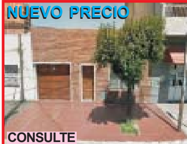
CONSULTE San Justo, Eizaguirre 2674, casa 2 amb, garage, lavad, patio, 1/2 cd Centro Comercial Arieta, 1 cd Av J.M. de Rosas, lote de 8.66x17 mtrs