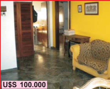
U$S 100.000 San Justo, Indart 2351, depto 2° piso por escalera, c/2 dormitorios, comedor, cocina, baño, lavadero cubierto, patio, balcón a la calle, cochera cubierto, pleno centro.-