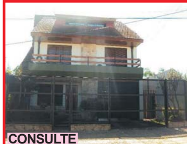
CONSULTE San Justo, Madariaga 4042, amplia propiedad 3 niveles living comedor, cocina, 4 dorm, lavad, quincho, garage pasante, lote de 10x40 mts