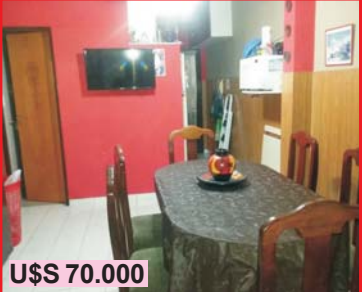
U$S 70.000 S. Justo, Rincón 2765, muy buen dúplex interno 2 dor + peq altillo, m/buena ubicación y vecindario, a mts de Universidad La Matanza