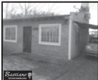
V.PINO, Chuquisaca 5500 km 46, lote 10x40 mts c/casa 2 ambientes, 35 m² cub, cocina comedor, dormitorio, baño con ducha y garage, valor $ 380.000, excelente!!!!