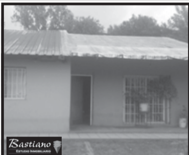
V.PINO, km 40, a 5 cds Ruta 3, Santiago del Estero 5960, lote 13.50x37.7 mts, casa 100 m², coc, liv com, 2 dor, bño, prque m/amplio, pocos detalles de terminación, $ 600.000.-