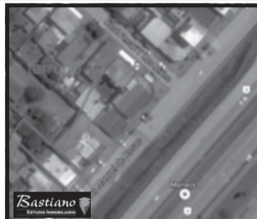
V.PINO, Colectora Ruta 3, km 42, lote 10x35 mts c/local, 130 m² cub en losa, amplio, al frente, garage y casa t/americana a remodelar, fondo libre, valor de u$s 120.000