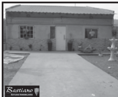
V.PINO, km 41.700, a 5 cdrs Ruta 3, Escribano 5324, lote 9x60, en condominio, casa super amplia, 136 m², 5 dor, 2 baños, amplia coc, lving com, ptio al fndo, parque, $ 750.000