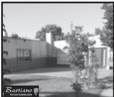
V.PINO, casa y locales, km 41.800, Ferrari 5657, a 4 cds Colectora y 1/2 asfalto, lote 18x45 casa 5 amb, gge2, qcho y lav, 3 locales a termin, al fnte c/200 m² losa, $ 950.000