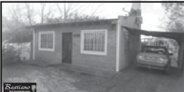
VIRREY DEL PINO, sobre la calle Chuquisaca al 5500 kilómetro 46, lote de 10x40 metros con casa de 2 ambientes, 35 m² cubiertos, cocina comedor, 1 dormitorio, baño con ducha y garage, un valor de $ 380.000, excelente!!!!!!