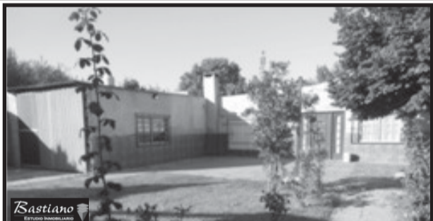
VIRREY DEL PINO, casa y locales, km 41.800, Ferrari 5657, a 4 cuadras de Colectora y 1/2 asfalto, lote 18x45 casa 5 ambientes, gara gex2, quincho y lavadero, 3 locales a terminar, al frente c/200 m² losa, $ 950.000.-