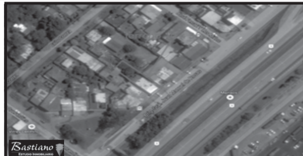
VIRREY DEL PINO, sobre la Colectora de la Ruta Nac° 3, kilómetro 42, lote de 10x35 metros con local, 130 m² cubiertos en losa, amplio, al frente, garage y casa tipo americana a remodelar, fondo libre, valor u$s 120.000