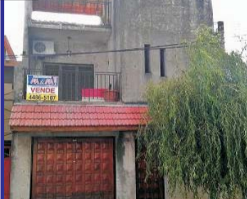
S/Sarrachaga, 3 dormis, baño, cocina, living comedor, garage cubierto, fondo libre, terraza c/lavd