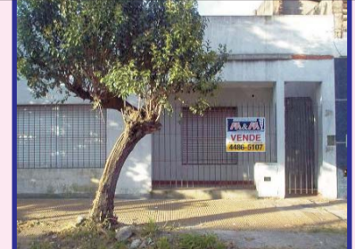
I. Casanova, s/l. Malvinas, casa a estrenar, living/comedor, cocina, 2 dormitorios, baño, patio y terraza.-