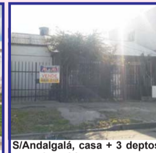
S/Andalgalá, casa + 3 deptos, casa 3 ambientes con garage, fondo 3 deptos tipo dúplex (2 a terminar), consulte valor en block o x separado.-