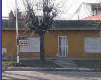
S/Seguí, 3 dormitorios, living comedor, cocina, 2 baños, lavadero, garage, parrilla, entrada para auto