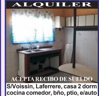
ACEPTA RECIBO DE SUELDO S/Voissin, Laferrere, casa 2 dorm cocina comedor, bño, ptio, e/auto