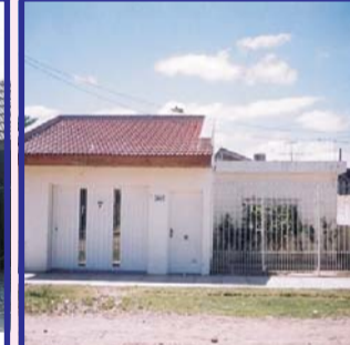
S/Anatole France: 3 prop, fte: casa liv com, 3 amb, bño, gria, e/auto, medio: depto 4 amb t/inst, fdo depto 4 amb a term