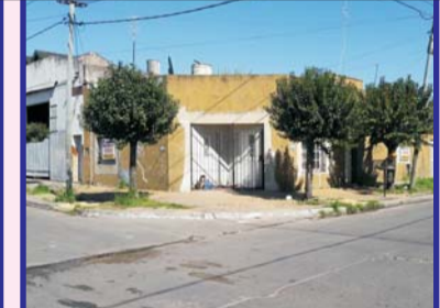
S/Madrid esquina México, casa cocina comedor, de 2 dormitorios, baño, garage, patio con lavadero, más departamento c/3 ambientes