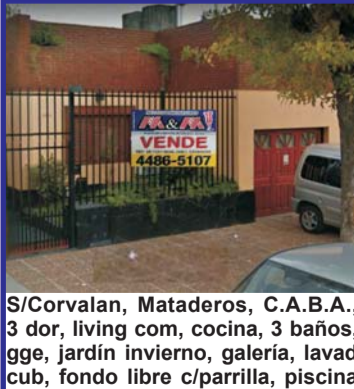
S/Corvalan, Mataderos, C.A.B.A., 3 dor, living com, cocina, 3 baños, gge, jardín invierno, galería, lavad cub, fondo libre c/parrilla, piscina