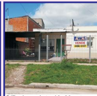
S/Bedoya, lote 10x39 mts, casa: 2 dor, coc/com, livg/com, baño, e/auto, ptio, depto fdo dor, coc/comd, baño, g/útiles