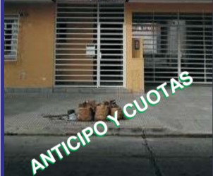
S/Avda Venezuela al 5700, lote 10x33 m, con casa precaria