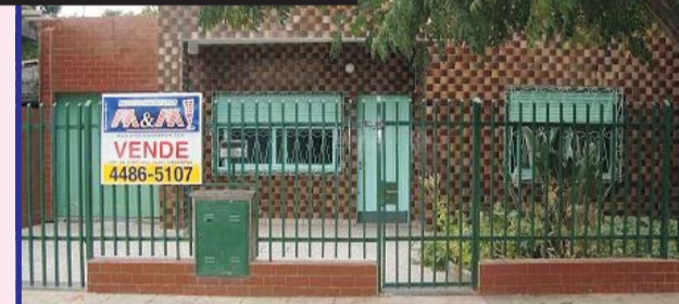
Sobre la calle La Paz, casa sobre lote de 10x30 metros, 3 ambientes, 2 dormitorios, cocina comedor, living comedor, baño, galería, garage, guarda útiles, con fondo libre