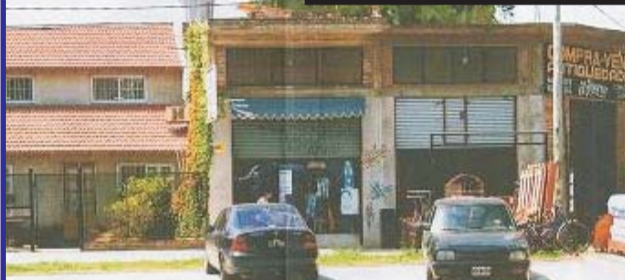
Sobre Juan Manuel de Rosas, casa con 3 locales de 3x10 metros instalados con altillo, casa: 3 amb, 2 dormitorios, cocina comedor, baño y lavadero semi cubierto