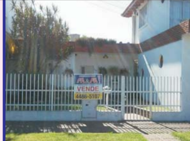
S/Seguí casa + depto: jardín al frente, liv com, coc, 4 dor, 2 baños, lav, gge, qncho, depto 2 plantas 4 amb