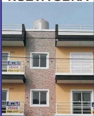
Isidro Casanova / San Justo sobre Sarrachaga y Madariaga, excelentes departamentos, todos totalmente instalados consultenos