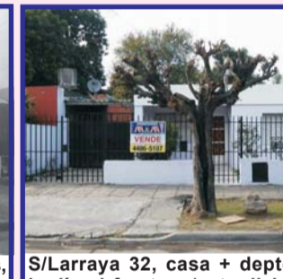
S/Larraya 32, casa + depto: jardín al frente, e/auto, living comed, coc com, baño, 2 dor, lav cub, depto 2 dormitorios, cocina comedor, baño, patio