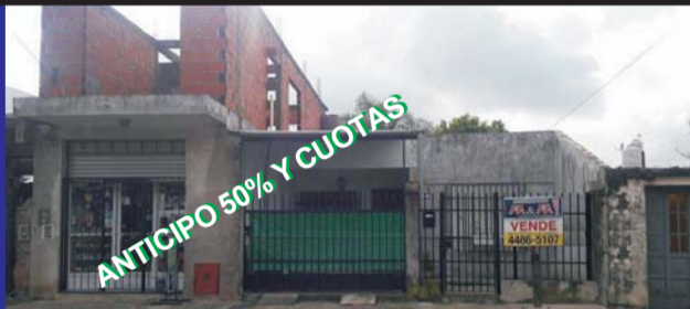
Sobre calle Albarracín, casa con local, 3 dormitorios, cocina comedor, comedor diario, living, 2 baños, local, lavadero, fondo libre, parrilla, entrada de auto, consulte.-