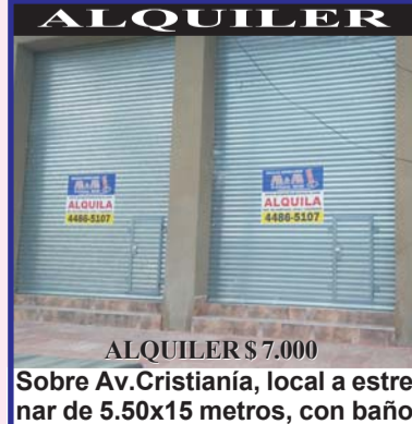
ALQUILER $ 7.000 Sobre Av. Cristianía, local a estrenar de 5.50x15 metros, con baño